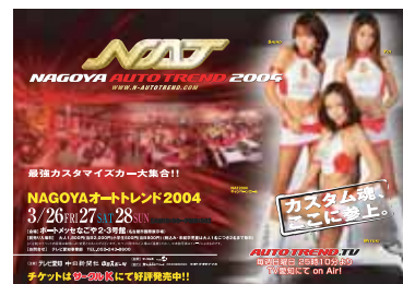
●サークルKポスター