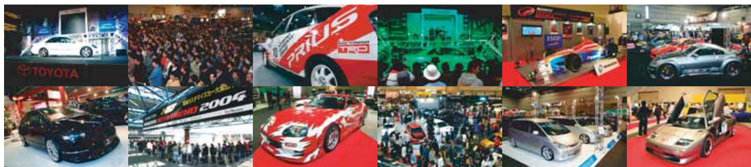
※NAGOYAオートトレンド2004会場風景