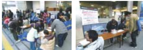
NAGOYAオートトレンド2005アンケート風景