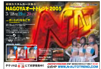
●サークルKポスター